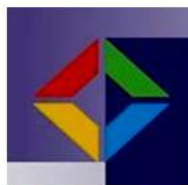
Národná platforma Dohovoru primátorov a starostov

Diskusia k Akčnému plánu Národnej platformy Dohovoru primátorov: otázky spolupráce v oblasti politiky súdržnosti a využitia dostupných finančných mechanizmov, zameraných na podporu cieľov Dohovoru primátorov do roku 2013 a v nasledujúcom programovacom období 2014-2020.